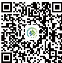
事业单位招聘信息